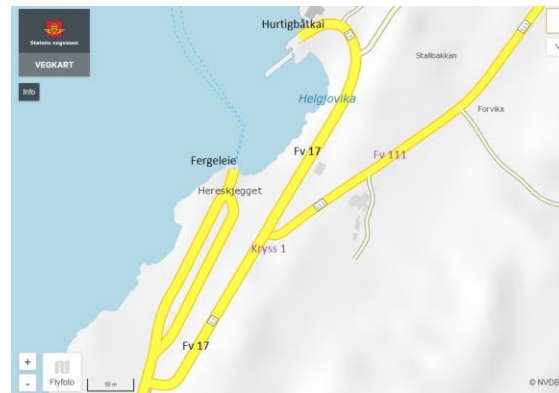
Kart 1:

Om status for Fv. 17 og Fv. 111 ved nytt fergeleie på Forvik og krysset til Korsvik, etter info fra Statens vegvesen.